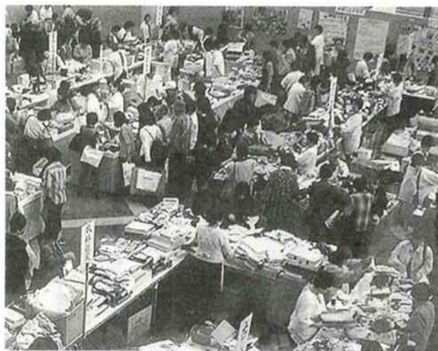
▲バザー会場の様子

第29回神樹の会バザーが十月二十六日、二十七日にハーバーランドスペースシアターにて開催されました。今年もたくさんの方々から温かい心をいただき、二十一世紀に向けて大きく飛躍していきたいと思えます。 バザーの収益金は各事業所の活動を支え、また、重度障害者療養施設建設のために積み立てられます。 皆様のご支援とご協力に心より感謝いたします。