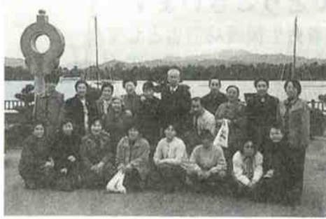
▲天の橋立を望んで

9月22日(金)午前10時30分より神戸市勤労会館3Fにおいて、臨時総会が行われました。その結果、神樹の会単独で療護施設を立ち上げること、それに伴う予算などが決まりました。