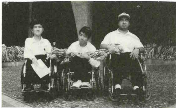
▲友生養護学校高等部卒業生のみなさん

今後、友生養護学校で学ばせてもらったことを教訓にし、頑張りたいと思えます。神樹の会のますますのご発展を祈ります。 (前友生養護学校校長)