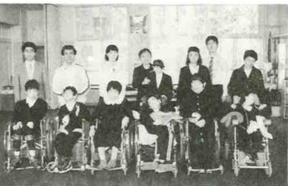
▲ 垂水養護学校高等部卒業生と先生方