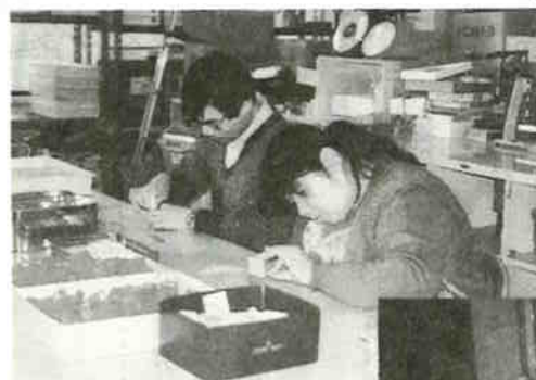
▲六甲作業所 印かんの組み立て をしています