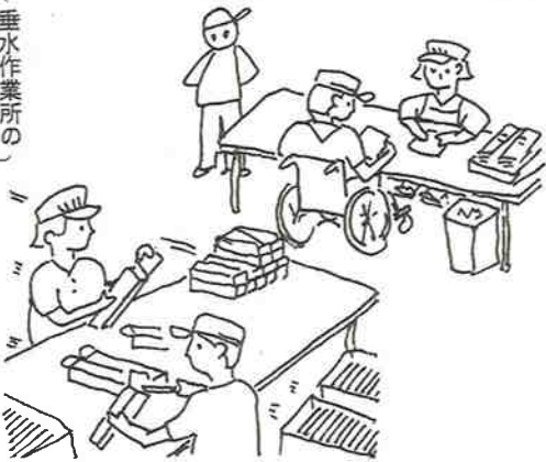
（垂水作業所の作業風景）

発足して十六年も経つと親たちが高齢化してきています。 こちらは養護学校卒業は昨年五名、今年は二名入所してお母さん達は若いのです。 ボランティアさんは頼んでいるのですか？ 親に替わる介助ボランティアはきてもらっていませんが、作業ボランティアをお願ひしています。親がやむなく休んでもそのままです。 垂水は親が長期にわたってこれられない時は親に替わるボランティアを頼んでいます。又、当番を休んだら補いをしています。 発足当時から所員の障害の程度により親の当番は六甲作業所では週一回、垂水作業所では週二回と違って来ています。トイレ介助のいる人やボランティアで当番の日以上きている人もいますね。