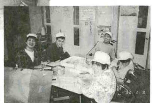
▶垂水作業所 たのしく作業を している様子

さわやかな太陽を浴び、野山の草木は若葉となつて人々の心を楽しませてくれます。神樹の会も新しい友を迎え、各作業所各デイサービスなど喜びのスタートをしました。暖かい心の絆をしっかりとって、愛の灯を更に明るくしたいと思ひます。去る三月には神戸市市民福祉顕彰奨励賞を贈られ会の活動に深い理解と励ましを頂きました。